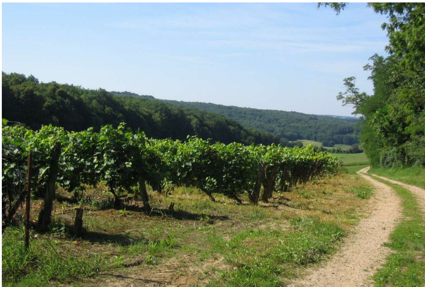
Paysage de vignes dans les Monts de Gy